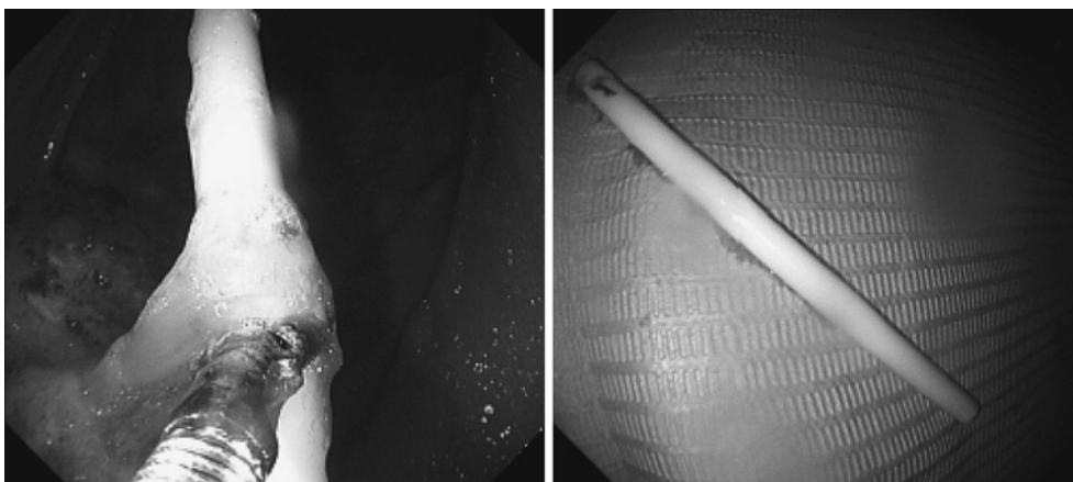
図3 上部消化管内視鏡所見