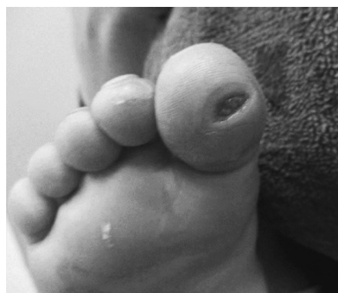
図2 受傷部位の写真 受傷当日の右母趾。真皮まで達する皮膚欠損。第2趾にも表皮剝離あり。